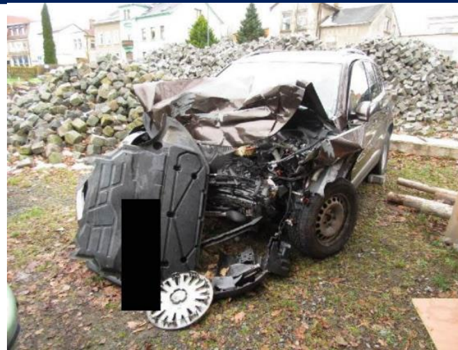
fotografie havarovaného auta ze systému Cebia