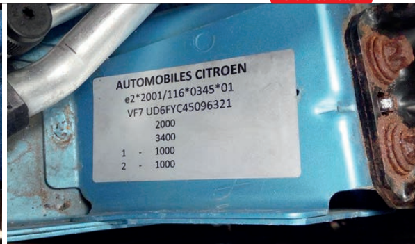
Prověření čísla VIN Citroënu C4 Picasso údajně z roku 2004 a dovezeného ze SRN dopadlo tristně. Ražba i typový štítek jsou padělky. Samotné VIN odpovídá roku výroby 2007, není to dovoz ze SRN a mělo by jít o auto s pravostranným řízením.